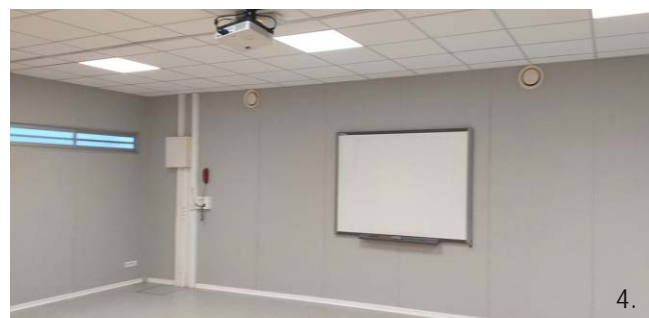
1. Salle des aînés 2. 3. Salle Jean Monnet 4. Salle rue des champs